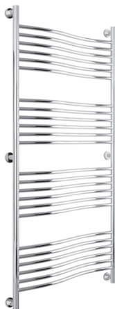
Рис. 1 Модель «Флюид+»

1.2. Конструктивно, радиатор изготавливается различных моделей и типоразмеров (рис. 1, 2, 3).