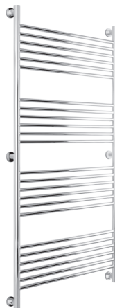
Рис. 2 Модель «Богема+» (прямая)