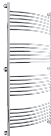
Рис. 3 Модель «Богема+» (выгнутая)